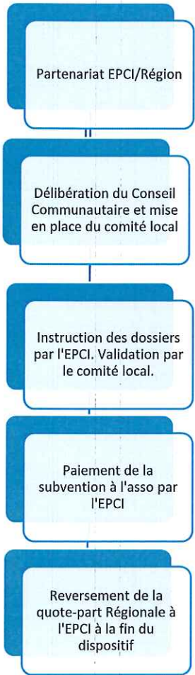
Schéma n°2 : Co-financement Région/communes Versement de la subvention par l'EPCI

Schéma n°1 : Co-financement Région/EPCI 50 % Région 50 % EPCI Versement par l'EPCI